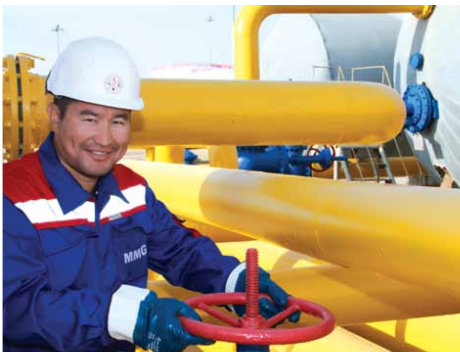
«Мангыстаумунайгаз» қызметкері / Сотрудник «Мангыстаумунайгаз» / Mangistaumunaigas employee

ет собой важный элемент корпоративной стратегии и относится к числу основных принципов ведения социально ответственного бизнеса. КННК считает важной задачей финансирование и реализацию значимых социальных проектов. Один из