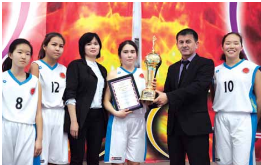
ПҚҚР кубогы үшін оқушылар арасында баскетболдан жарыс / Турнир по баскетболу среди школьников на Кубок ПҚҚР / Basketball tournament among pupils for PKKR Cup

7 May - the naphtha splitter received its first feedstock intake. Comprehensive testing was started at the PKOP Isomerisation Unit. All these works are being implemented within the framework of PKOP Modernization Project.