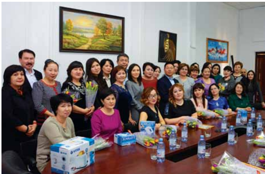
ПҚҚР-дағы халықаралық әйелдер күнін 8 наурызды тойлау / Празднование международного женского дня 8 марта в ПҚҚР / Celebration of International Women's day in PPKR

рына сәйкес ҚР МӨЗ-де К4 және К5 экологиялық сыныпты бензин мен дизель жанармайын өндіру бойынша жол картасы әзірленіп, «ҚМГ ҰК» АҚ тарапынан бекітілді.