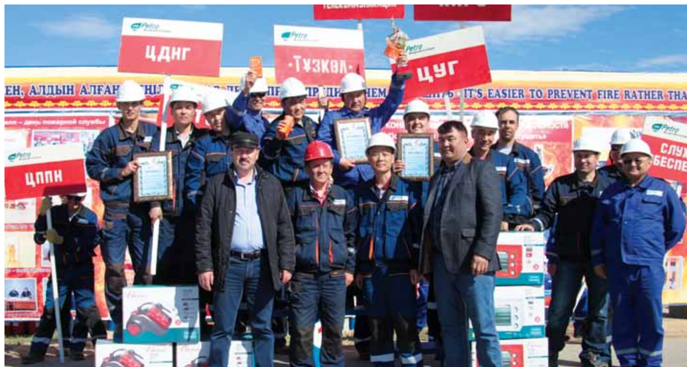
«Өртті сөндіргеннен, алдын алған оңай!» атты өрт қауіпсіздігі байқауының жеңімпаздары / Победители конкурса по пожарной безопасности «Пожар легче предупредить, чем потушить!» / Winner of fire safety competition "A fire is easier to prevent than put out!"

4 мая - в рамках празднования 72-й годовщины Победы в Великой Отечественной войне компания «ПетроКазахстан»