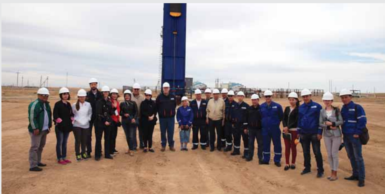
Құмкөл кен орнында / На месторождении Құмколь / At Kumkol oilfield

"Akmeshit Akshamy" newspaper, №37-38 dated 7 June 2017 Two days to be remember Ulykbek Bekuzakuly