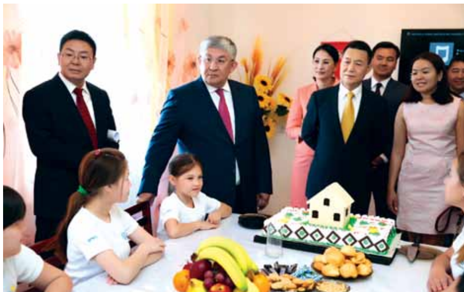
Кызылорда облыс әкімі Қ.Е. Көшербаев пен ПҚКР басшылығы «Атамекен» балалар ауылында / Аким Кызылординской области К.Е. Кушербаев с руководством ПҚКР в детской деревне «Атамекен» / Akim of the Kyzylorda Oblast K. Kusherbayev with the PKKR top management in the "Atameken" children's village

- As with any executive, every day is full of finding solutions to everyday issues, analysing a range of situations, determining future development goals, and spending time in meetings and at conferences.