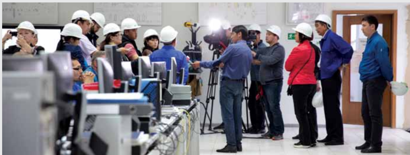
Шымкент МӨЗ-нің операторлық орталығында / В операторной Шымкентского НПЗ / In the operators' room of the Shymkent Refinery

“The refinery has been undergoing modernization work since 2011, which is due to end in September 2018. Refinery operations never stand still - the place is humming! The refinery site, which we were given a tour of, after preliminary safety instructions (which are of the utmost importance at the refinery), is one large building site with new facilities being built and technical lines being reconstructed.”