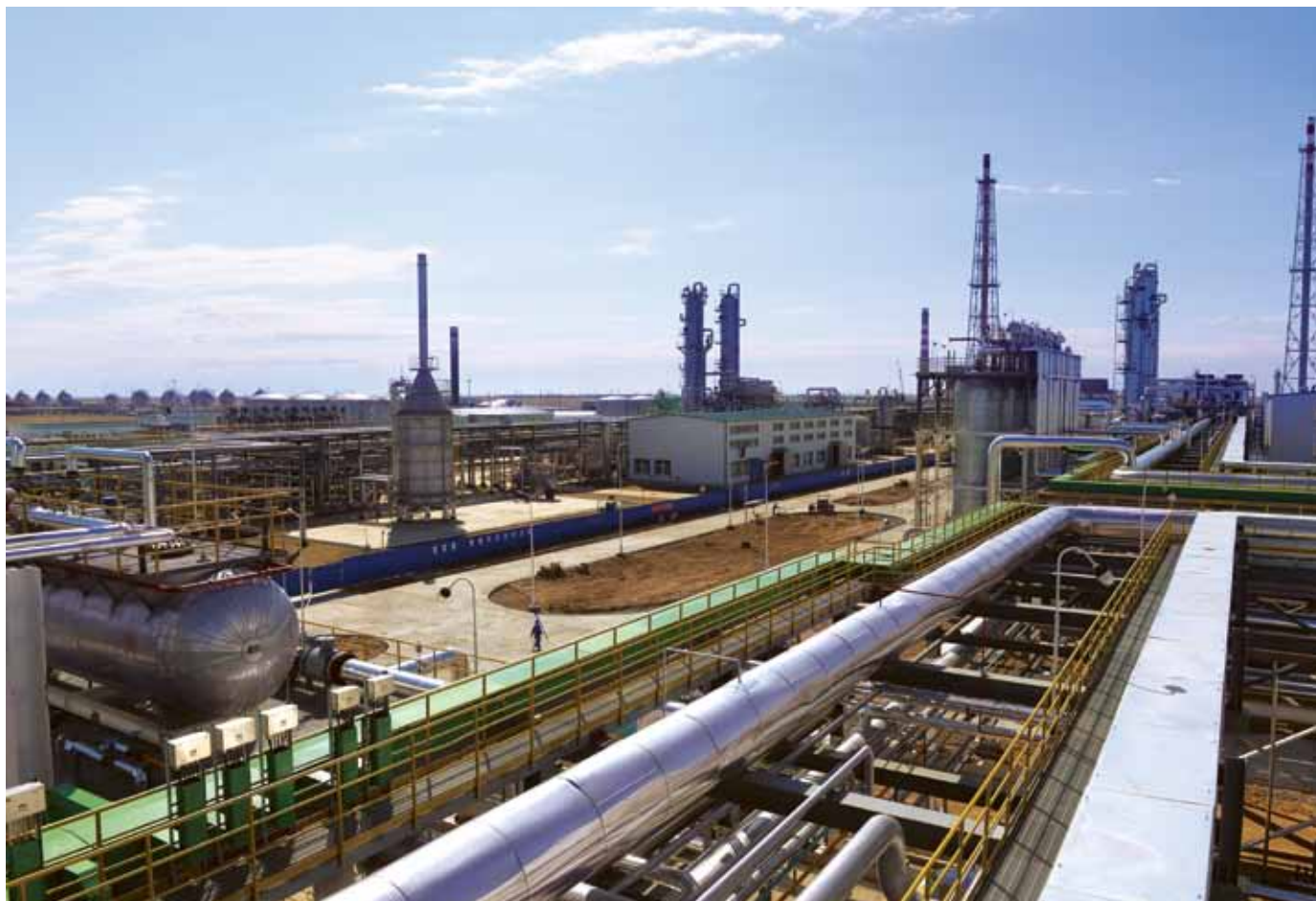
3-ші Жанажол газ өңдеу зауыты / 3-й Жанажольский газоперерабатывающий завод / 3rd Zhanazhol gas processing plant

КННК осуществляет инвестиционную деятельность более чем в шестидесяти странах мира.