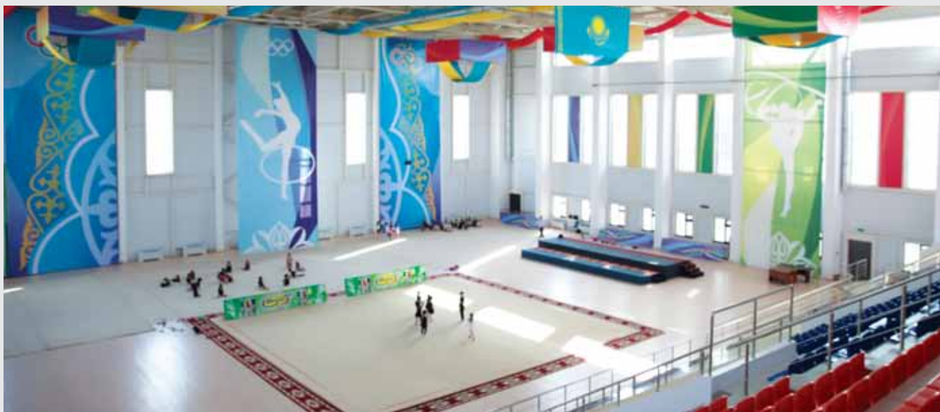
А.Юсупова атындағы көркем гимнастика мектебі, Шымкент қ. / Школа художественной гимнастики им.А.Юсуповой, г.Шымкент / Artistic Gymnastics School after A.Yussupova in Shymkent

“South Kazakhstan” newspaper, 26 May 2017 New demands - new possibilities N.Kbaikina