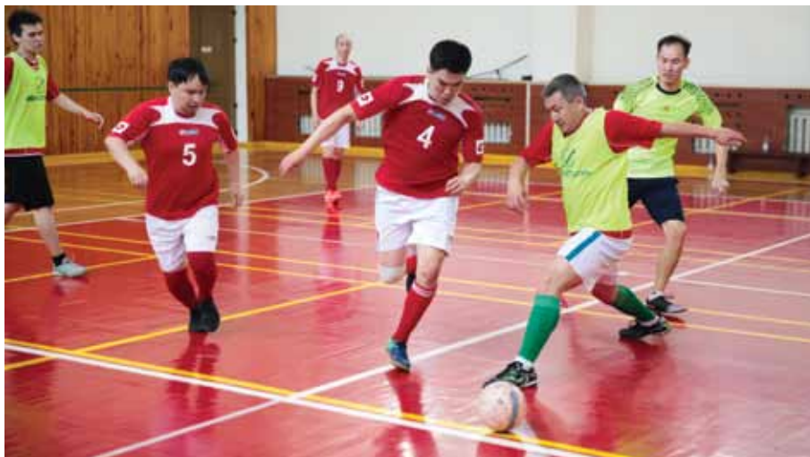
ПККР бөлімшелері арасындағы мини-футболдан дәстүрлі жарыс / Традиционный турнир по мини-футболу среди подразделений ПККР / Traditional mini-football tournament among PKKR divisions

РК в соответствии с требованиями технического регламента ТР ТС 013/2011.