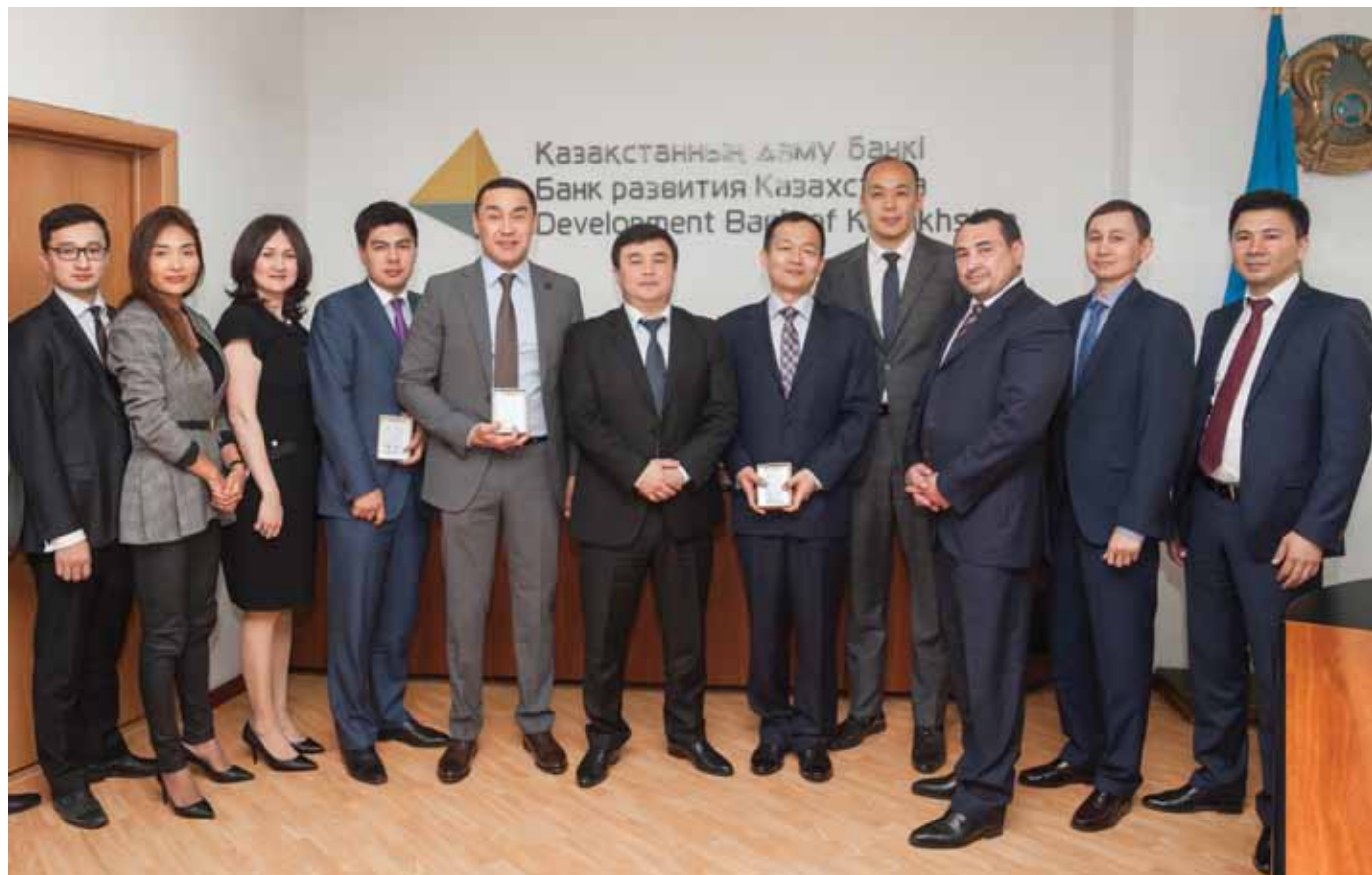
«Қазақстан Даму Банкі» АҚ және «ПҚОП» ЖШС басшылықтары арасында Шымкент МӨЗ жаңғырту жобасын қаржыландыру үшін несие желісін ашу туралы келісімге қол қою рәсімінде /Руководство «Банка Развития Казахстана» и ТОО «ПҚОП» на подписании соглашения об открытии кредитной линии на финансирование Проекта модернизации Шымкентского НПЗ / Development Bank of Kazakhstan and PKOP management during signing an agreement to open a credit line to finance the Shymkent Refinery Modernization Project

Дизельдік жанармайдың жағдайы да сол сияқты (ол да К-2 экологиялық классқа сәйкес келеді). Бензолға келетін болсақ, бүгінгі 5% (көл.) көрсеткіштер жаңа К-5 жанармайында 1,0% (көл.) дейін төмендетілетін болады. Осыған орай, қалаларымыздағы ауа да тазара түспек.