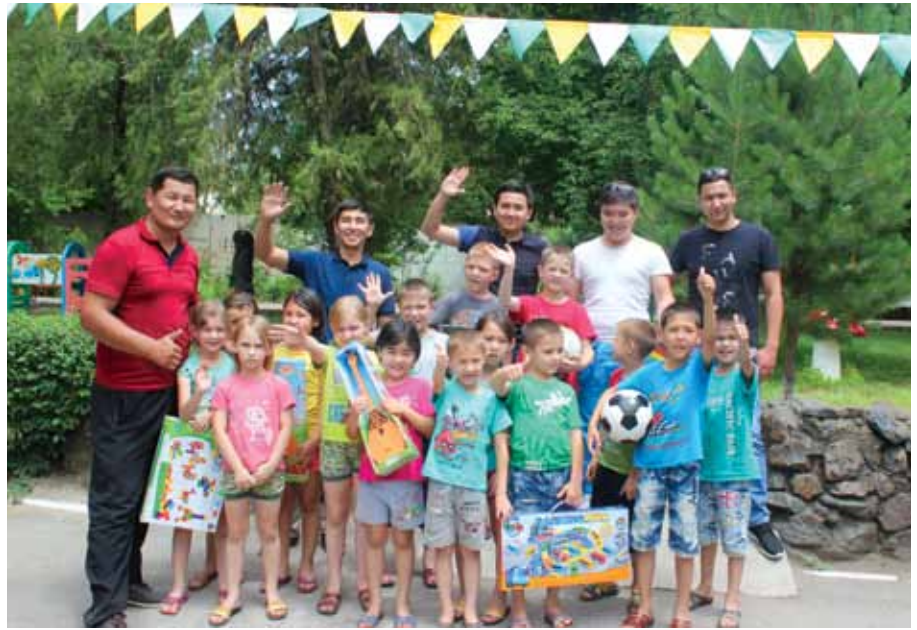
«ПҚОП» ЖШС-ның ИЖБД қызметкерлері мен №3 балалар үйі тәрбиеленушілері. Қайырымдылық шара / Сотрудники ДИИУПТОО «ПҚОП» с ребята из Детского дома №3. Благотворительная акция / PKOP E&PM department employees with children from Orphanage №3. The charity campaign.

31 наурыз - «ПҚОП» ЖШС-нде құрылысы Зауытты жаңғырту жоба-