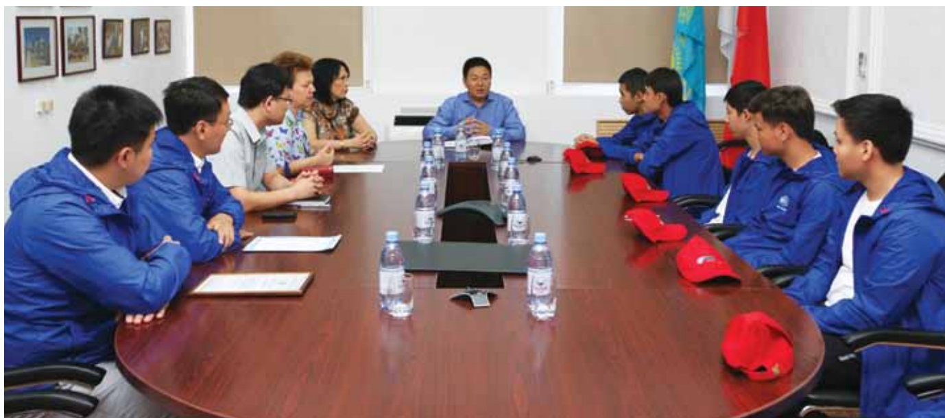
Жас геологтардың ПҚКР басшылығымен кездесуі / Встреча юных геологов с руководством ПҚКР / Meeting of young geologists with PKKR management

I would like to take this opportunity to thank my Kazakhstan friends for their friendship, the help they have always given me and continue to give me while I am in Kazakhstan, and in particular in Kyzylorda Oblast.