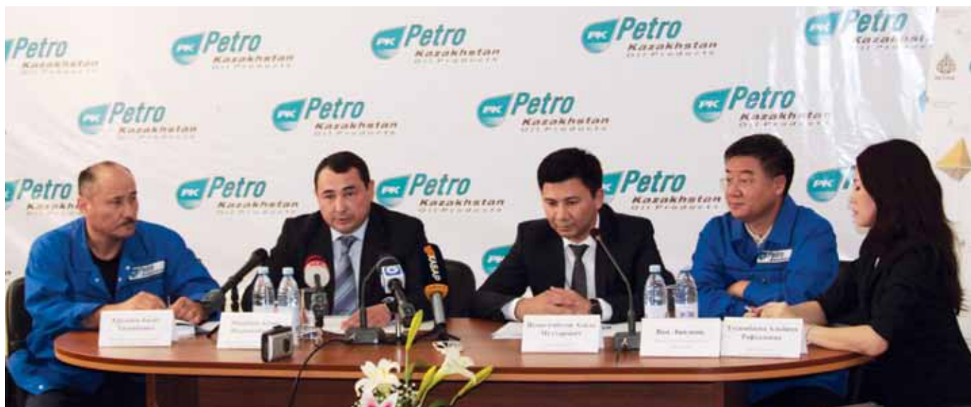
ПКОО-тың Жаңғырту жобасын қаржыландыру туралы баспасөз мәслихатында / На пресс-конференции по случаю финансирования БРК Проекта модернизации ПКОО / At the press-conference on financing of PKOP Modernization Project by Development Bank of Kazakhstan

Аналогичны цифры по дизелю, также сейчас соответствующему экологическому классу К-2. Что касается бензола, то эти показатели снизятся с сегодняшних 5% (об.) до 1,0% (об.) в новом топливе К-5. А значит, воздух в наших городах станет чище.