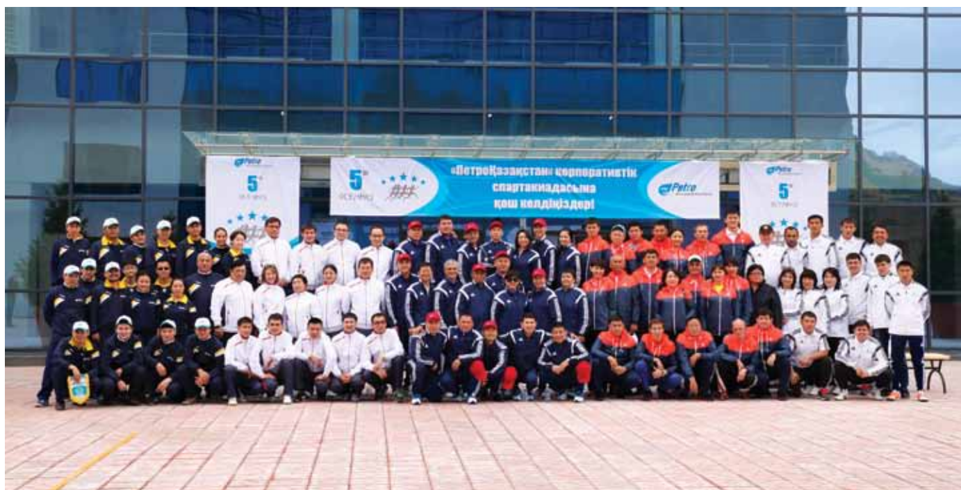
«ПетроҚазақстанның» V мерейтойлық олимпиадасы / V Юбилейная Спартакиада «ПетроКазakhstan» / V Anniversary PetroKazakhstan Olympics