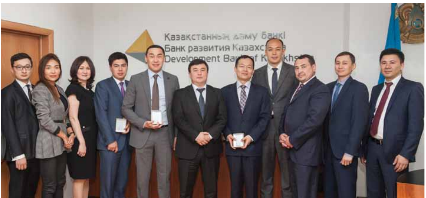
«Қазақстан Даму Банкі» АҚ және «ПҚОП» ЖШС басшылықтары арасында Шымкент МӨЗ жаңғырту жобасын қаржыландыру үшін несие желісін ашу туралы келісімге қол қою рәсімінде /Руководство «Банка Развития Казахстана» и ТОО «ПҚОП» на подписании соглашения об открытии кредитной линии на финансирование Проекта модернизации Шымкентского НПЗ / Development Bank of Kazakhstan and PKOP management during signing an agreement to open a credit line to finance the Shymkent Refinery Modernization Project

Similar values are true for diesel (which also currently complies with K-2 emission standard). As for benzene, its content will be reduced from current 5% (vol.) to 1.0% (vol.) in the new K-5 fuel. This means that the air in our cities will become cleaner.