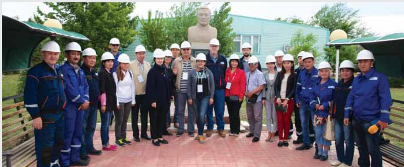
Медиа-турдың қатысушылары Құмкөлде, М.Г.Саламатовтың ескерткіші жанында / Участники медиа-тура на Кумколе, возле памятника М.Г.Саламатову / Media tour participants at Kumkol, near the Salamатов's monument

«Ақмешіт ақшамы» газеті, №37-38, 2017 жылғы 7 маусым «Есте қалар екі күн» Ұлықбек Бекұзақұлы