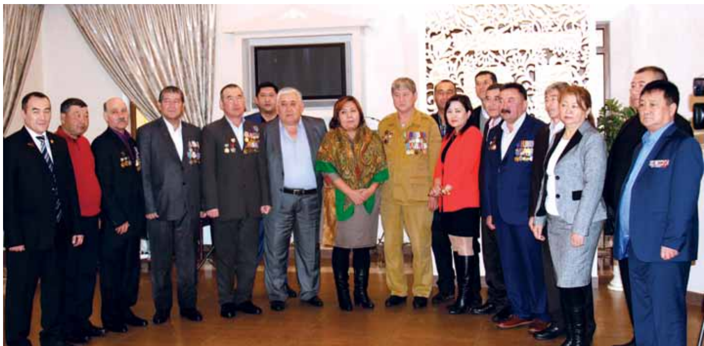
ОҚО ауған соғысы ардагерлері одағының өкілдері мен ардагер-интернационалистер, «ПҚОП» ЖШС-ның қызметкерлері Ауғанстаннан әскерді шығару күнін атап өтуде / Празднование Дня вывода войск из Афганистана ветеранами-интернационалистами, сотрудниками ТОО «ПҚОП», совместно с представителями Союза афганцев ЮКО / Celebration of the Day of withdrawal of troops from Afghanistan by veterans, PKOP employees, together with representatives of the SKO Afghan Union

5 May - 9 June - PKOP employees undergo annual medical check-ups in accordance with an Order of the Ministry of the National Economy.