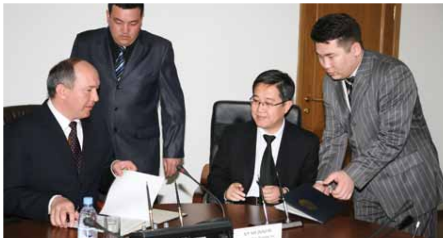
Компания башпылығы және Кызылорда облысы әкімдігі арасындағы Ынтымақтастық туралы Меморандумға қол қою, 2009 жыл / Подписание Меморандума о сотрудничестве между руководством компании и Акиматом Кызылординской области, 2009 год / Signing the Memorandum on cooperation between company management and the Kyzylorda Oblast Akimat, 2009

В 2016 году ПККР было выделено 151,7 млн. тенге на ставшие традиционными социальные проекты и поддержку подшефных организаций. В течение последних 5 лет общая сумма расходов группы на спонсорские цели составила 86 млн. долл. США, и особое место занимали проекты инфраструктурного и экономического развития регионов в рамках Меморандума о