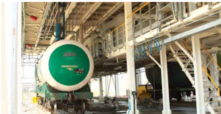
Қазақстандағы алғашқы автоматтандырылған құюды қамтамасыз ететін қондырғы / Первая в Казахстане автоматическая установка точечного налива нефтепродуктов / The first in Kazakhstan on-spot oil product loading unit

Ал 23 маусымда қуаты жылына 2,5 млн. тонна мұнай өнімдерін вагонцистерналарға саңылаусыз, дәл құюды