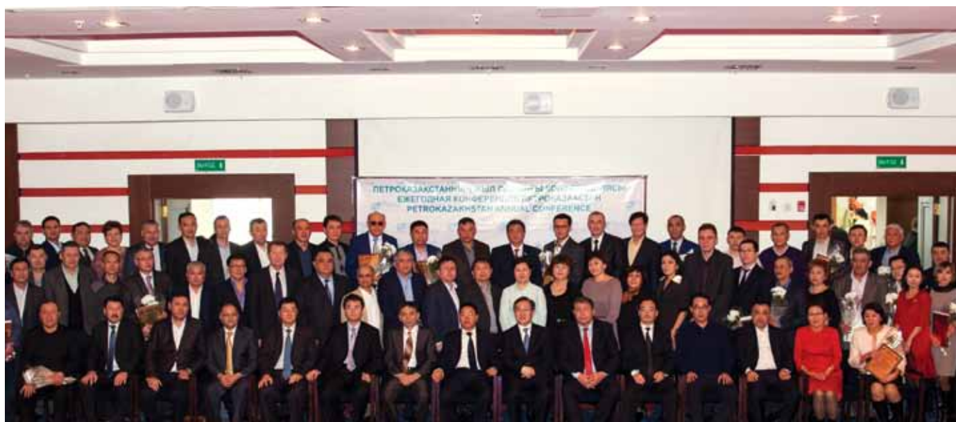
Бірінші «ПетроҚазақстан» жыл сайынғы конференциясы / Первая ежегодная Конференция «ПетроКазakhstan» / The first annual PetroKazakhstan Conference

We are constantly trying to increase the efficiency and the social importance of charitable and sponsorship activities aimed on improving the welfare of