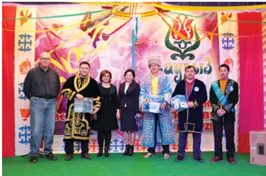
Кумкөлдегі көктем мерекесі / Праздник Весны на Кумколе / Spring celebration at Kumkol

15 March - Ecological Standard LLP experts finished their recording of PKOP greenhouse gas emissions. The 2016 emissions' verification report registered with the Ministry of Energy Committee for Ecological Regulation, Control and State Inspection states that emissions did not exceed levels set by the National Plan for the Allocation of Greenhouse Emission Quotas for 2016-2020.