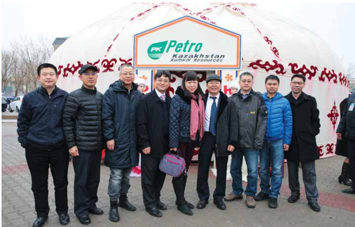
Наурыз мейрамын мерекелеу кезінде / На праздновании Наурыза / At Nauryz celebration

Осы мүмкіндікті пайдалана отырып, өзімнің қазақстандық достарыма менің Қазақстанда, нақтырақ айтқанда, Қызылорда облысында өткізген бүкіл уақытым ішінде олардың маған әрдайым көрсеткен әрі көрсетіп келе жатқан көмегіне, достығына алғысымды білдіргім келеді.