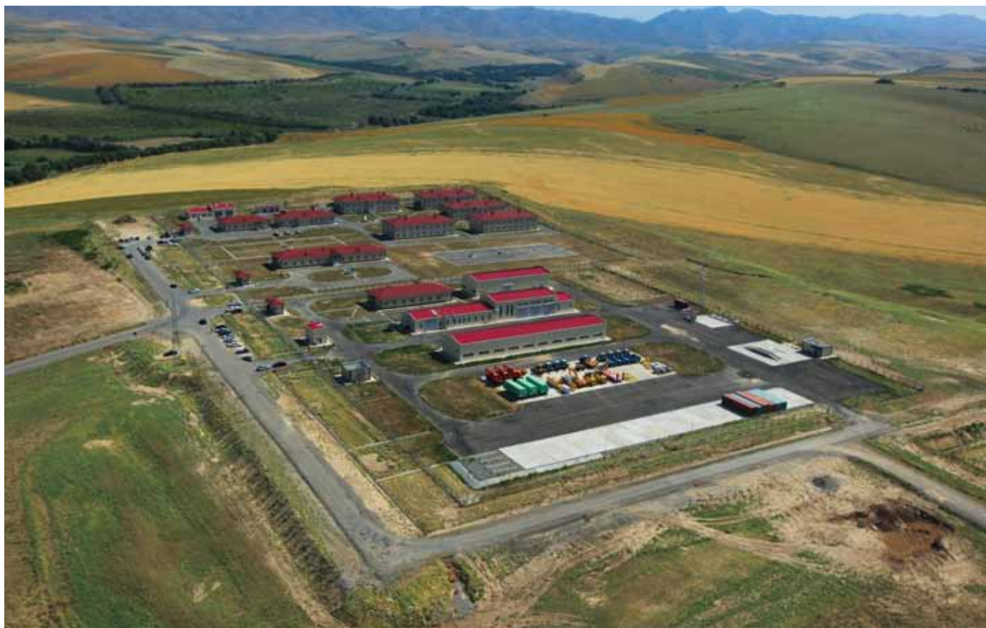
«Азиялық газ құбыры» ЖШС-ның өндірістік нысаны / Производственный объект ТОО «Азиатский газопровод» / Production facility of Asia Gas Pipeline LLP

ҚҰМК өзінің инвестициялық қызметін әлемнің алпыстан астам елінде жүзеге асырады.