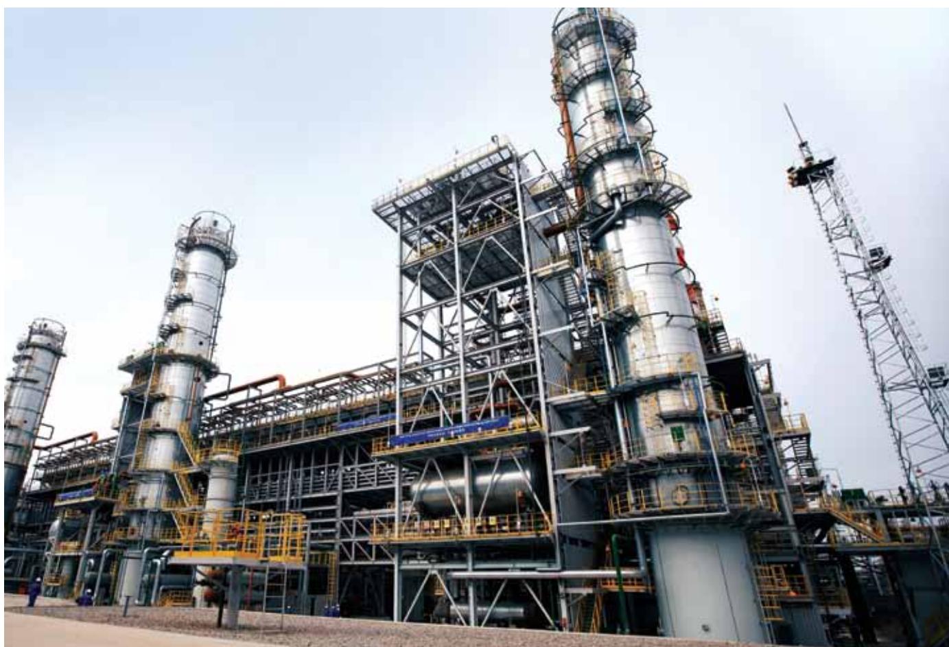
Изомеризация қондырғысы / Установа изомеризации / Isomerization Unit