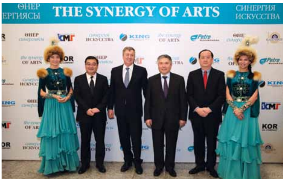
«Өнер синергиясы» атты «ПетроҚазақстан» мерекелік шарасының мәртебелі қонақтары / Высокие гости на имиджевом мероприятии «ПетроКазakhstan» «Синергия искусства» / Honored guests at PetroKazakhstan image event the 'Synergy of Arts'

қан өңірлер алдында тұрған, әлеуметтік тұрғыдан елеулі проблемаларды шешуге қатысу корпоративтік стратегияның маңызды элементі болып табылады және әлеуметтік тұрғыдан жауапкершілігі мол бизнесті жүргізудің негізгі қағидаларының қатарына жатады. ҚҰМК әлеуметтік тұрғыдан маңызды жобаларды қаржыландыру мен оларды жүзеге асыруды маңызды міндет деп санайды. Соңғы кезде орын алған осындай