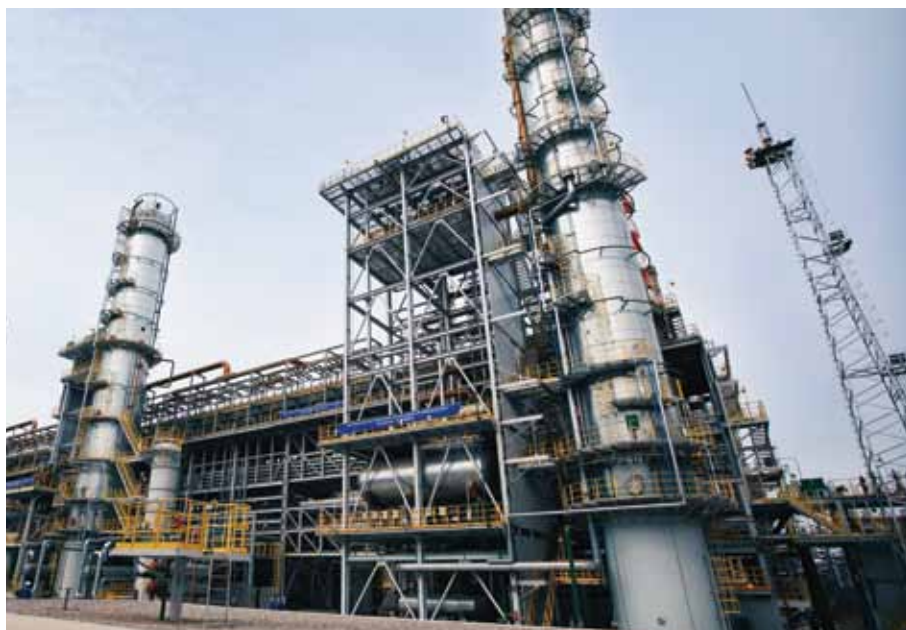
Изомеризация қондырғысы / Установка изомеризации / Isomerization Unit

Our congratulations to PKOP team with the successful completion of 1st stage of the Modernization Project!