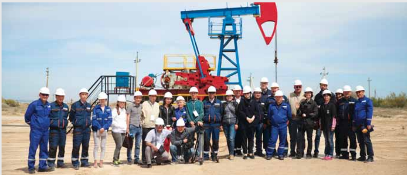
Кумкөл кен орнында / На месторождении Кумколь / At Kumkol oilfield

Газета «Ақмешіт ақшамы», №37-38 от 7 июня 2017 «Два дня, которые останутся в памяти» Улықбек Бекузакұлы