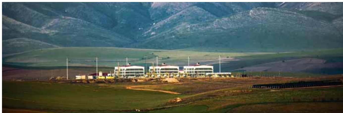
Азиялық газ құбыры / Азиатский газопровод / Asia Gas Pipeline

PetroKazakhstan Oil Products LLP wins the "Paryz" award for its contribution to the ecology.