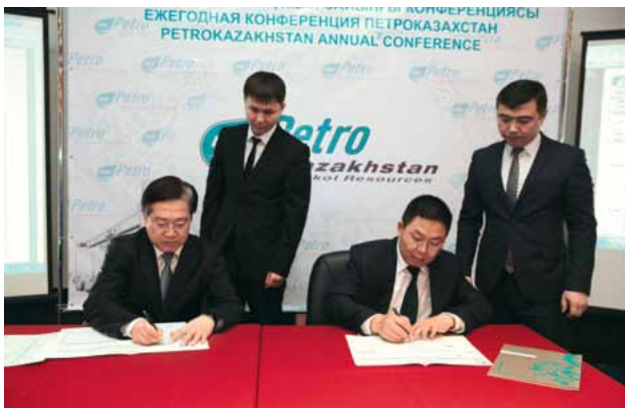
Бірінші «ПетроҚазақстан» жыл сайынғы конференциясы / Первая ежегодная Конференция «ПетроКазakhstan» / The first annual PetroKazakhstan Conference

- Can you tell us something about current global challenges and the