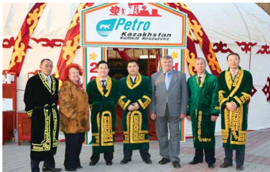
Қызылордада Наурыз мейрамын мерекелеу кезінде / На праздновании Наурыза в г.Кызылорда / At Nauryz celebration in Kyzylorda

The most important qualities I think in Kazakhstani people is respect to everybody. We are working successfully for so many years. People know each other and try