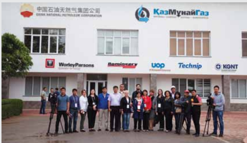
Шымкент МӨЗ-де /На Шымкентском НПЗ/ At Shymkent Refinery

«В настоящее время на заводе реализуется проект модернизации. Модернизация началась в 2011 году и закончится в конце сентября 2018 года. При этом основное производство на заводе не останавливается ни на минуту – работа кипит! Территория завода, которую мы осмотрели, предварительно пройдя тщательный инструктаж по технике безопасности (ей здесь придается огромное значение), – это одна большая стройка. Строятся новые объекты, реконструируются технологические линии завода».