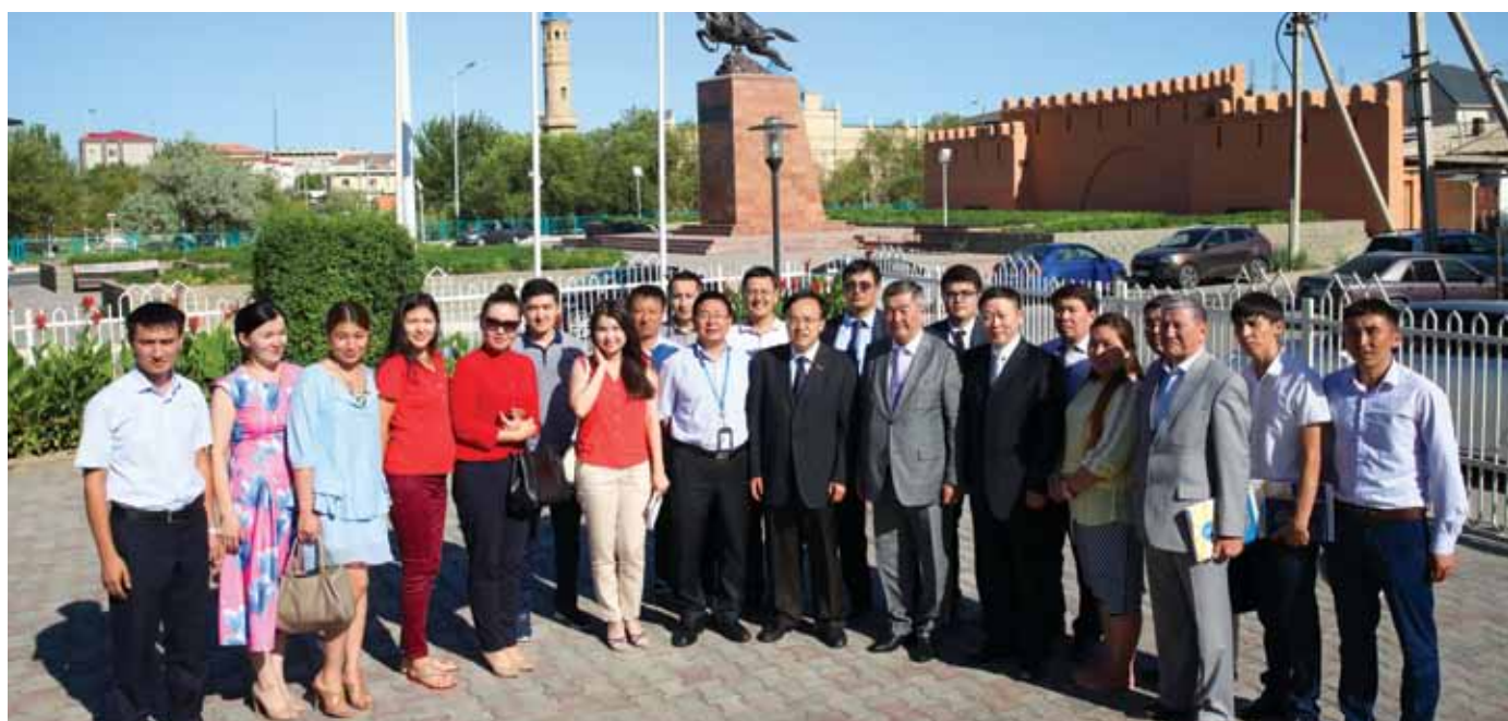
«ПетроКазахстан» стипендиялық бағдарламасының түлектерінің Қытай мұнай университетінен келген қонақтарымен кездесу барысында, Қызылорда қ. / Встреча гостей из Китайского нефтяного университета с выпускниками Стипендиальной программы «ПетроКазахстан», г.Кызылорда / Meeting of the guests from the China University of Petroleum with PetroKazakhstan Scholarship programme graduates in Kyzylorda

Пользуясь случаем, я хотел бы поблагодарить своих казахстанских друзей за дружбу, за ту помощь, которую они мне всегда оказывали и оказывают в течение всего времени, которое я провел в Казахстане и в частности в Кызылординской области.