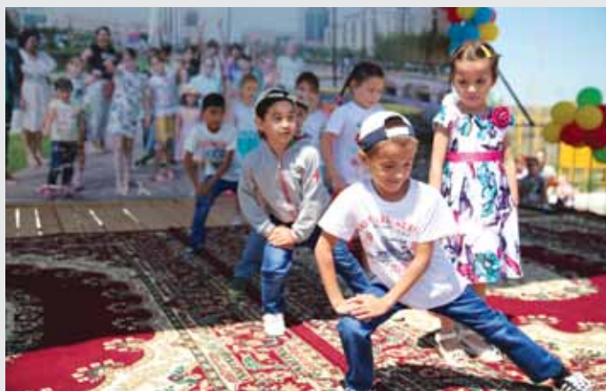
«Атамекен» балалар үлгісіндегі ауылындағы концерт / Концерт в детской деревне «Атамекен» / A concert at Atameken Children's Village

Газета «Новое поколение», №56 от 25 мая 2017 «Операция на работающем моторе» Алан Байтенов