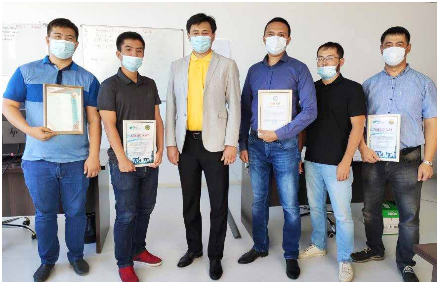
Мұнайшы күнін марапаттау салтанатында, Қызылорда / Церемония награждения в честь Дня нефтяника, Қызылорда / Oilman's Day award ceremony, Kyzylorda