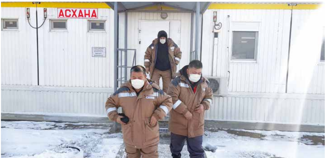
Батыс Түзкөлдегі асхана бөлмесі / Помещение столовой на Западном Түзколе / West Tuzkol canteen

We would like to wish everyone working at West Tuzkol further successes and new records. Thank you for your efforts and contribution to company development!