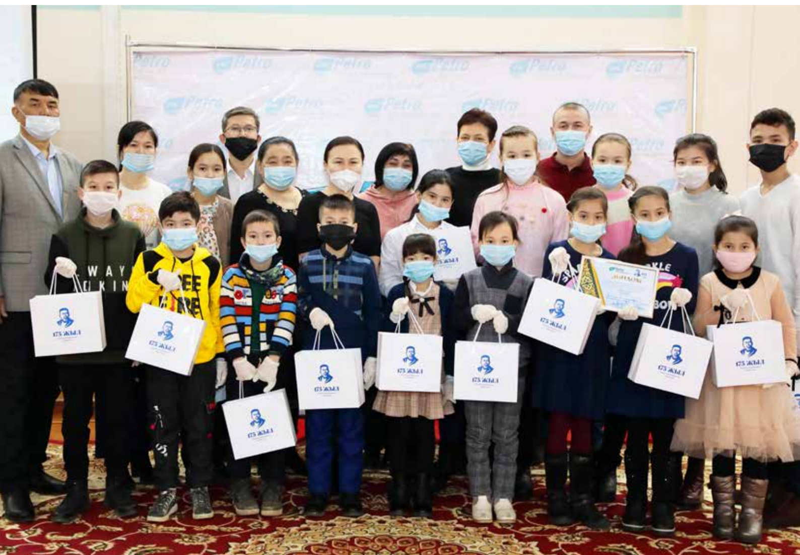
Абай Құнанбайұлының 175 жылдығына арналған «Ұлы Абай» онлайн-конкурсының жеңімпаздары, Қызылорда / Победители онлайн-конкурса «Великий Абай», посвященного 175-летию со дня рождения Абая Кунанбаева, Кызылорда / Winners of the online competition "Great Abai" dedicated to the 175th anniversary of the birth of Abai Kunanbayev, Kyzylorda