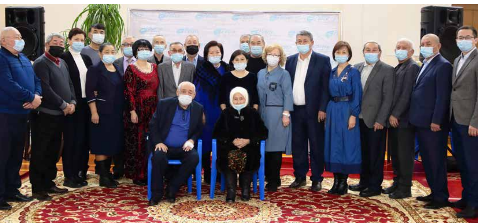
«ПетроҚазақстан» спорт кешенінде өткен қызметкерлерді зейнеткерлік демалысқа шығарып салу және ПҚКР ардагерлеріне құрмет көрсету салтанаты / Торжественные проводы работников на заслуженный отдых и чествование ветеранов ПҚКР, прошедшие в спорткомплексе «ПетроҚазақстан» / A formal ceremony for the employees of PKKR leaving for a much deserved retirement and an honoring of PKKR veterans in the sports complex "PetroKazakhstan"